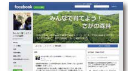
Facebookでの普及啓発 「みんなで育てよう！さかの森林」 で検索してください。