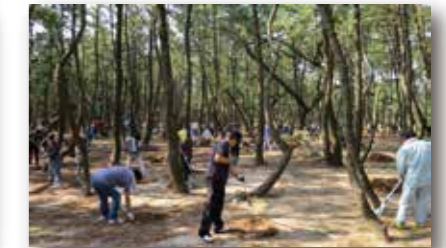
虹の松原の再生・保全活動