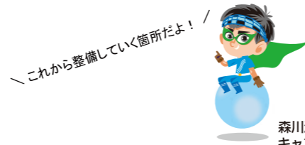
森川海人プロジェクト キャプテン 森川海人くん