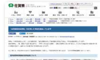
ホームページでの情報提供

【概要】 さかの森林再生事業の紹介、事業計画・実績の公表、ホームページの運用管理など、広報媒体を活用してPRを行います。 【事業主体】 県