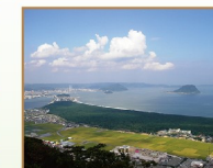
虹の松原の再生・保全活動