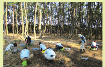
虹の松原の再生・保全活動