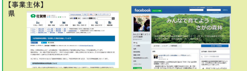
ホームページでの情報提供

【概要】 さかの森林再生事業の紹介、事業計画・実績の公表、ホームページの運用管理など、広報媒体を活用してPRを行います。