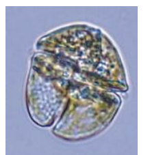
カレニア ミキモトイ

次回調査は6月17日(月) に予定しています。 但し、天候次第では変更することがあります。