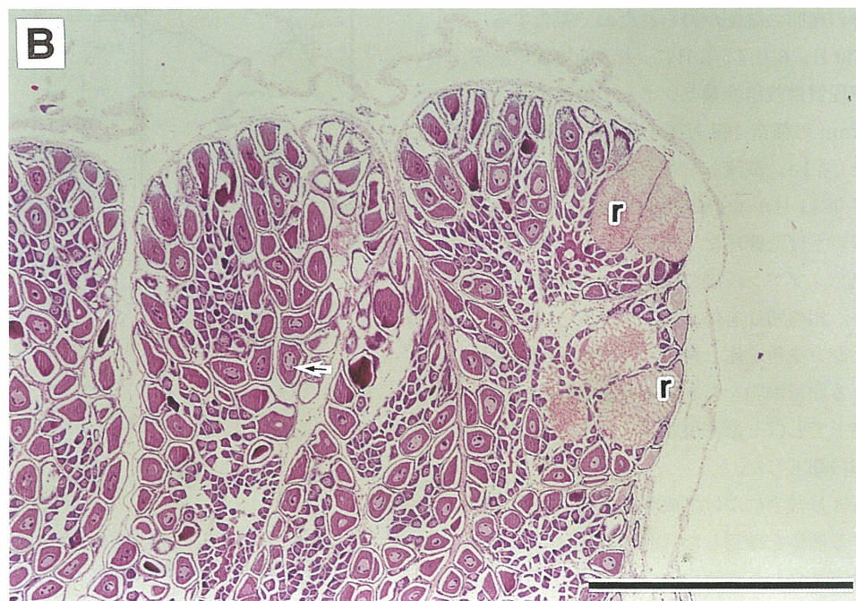
図2 A：成熟期の卵巣。卵巣は前成熟の卵母細胞（p）で充満している。 B：産卵後期の卵巣。産卵後の残存成熟卵（r）が認められる。矢印は卵黄蓄積途上の卵母細胞。 スケールはいずれも1 mm.