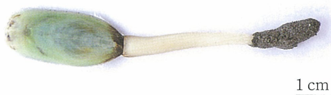
図1 背殻長 3.4 cm のミドリシャミセンガイ

実験に用いたミドリシャミセンガイ (234 個体) は、1999 年 6 月 16 日に Fig. 2 に示した筑後川河口の砂泥質の干潟で採集した。採集した個体は、実験室に持ち帰り、100 l パンライト水槽へ収容した。室内は暗くし、水温は約 22°C に保った。通気はエアーストンをを用いて