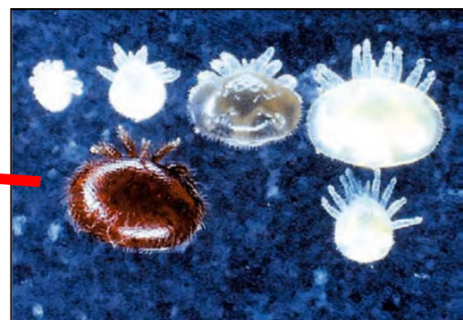
ミツバチヘギイタダニ