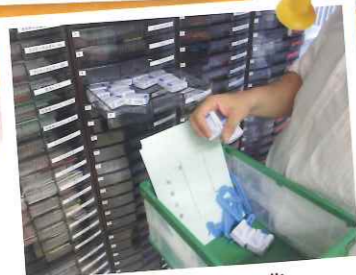
ピッキング作業 (依頼された品物をそろえます)