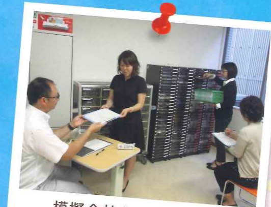
模擬会社を通しての訓練