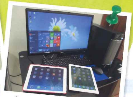
パソコン・タブレットの活用