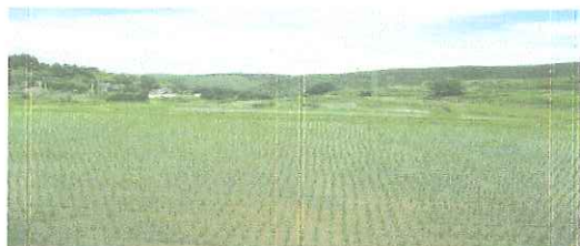
5月…田植え 緑の絨毯が初夏を知らせてくれます。