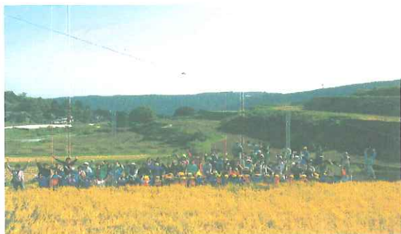
「教育ファーム：園児と保護者の稲刈り風景」