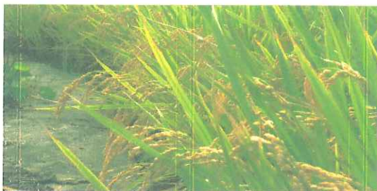
10月…金メダル級のお米の誕生です。