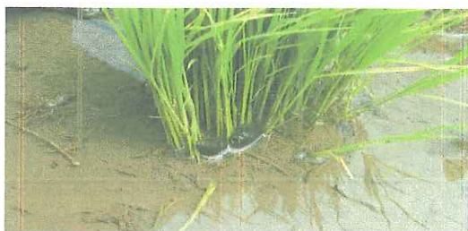
8月…タニシやおたまじゃくしが安全を証明してくれます。