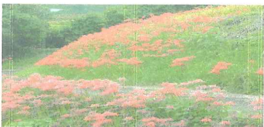
9月…田んぼの畔に彼岸花が見事に咲き誇ります。