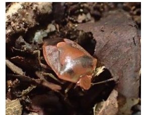
越冬中のチャバネ アオカメムシ