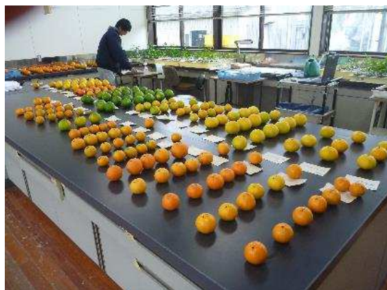
写真3 果実調査状況

酸切れが早く年内から年明けに出荷できる品種や初夏までに出荷できる品種など、幅広い時期に出荷可能なカンキツ品種の育成に取り組んでいます。また、育種の効率化を図るため、DNA分析法も活用しながら選抜を行っています（写真3、4）。