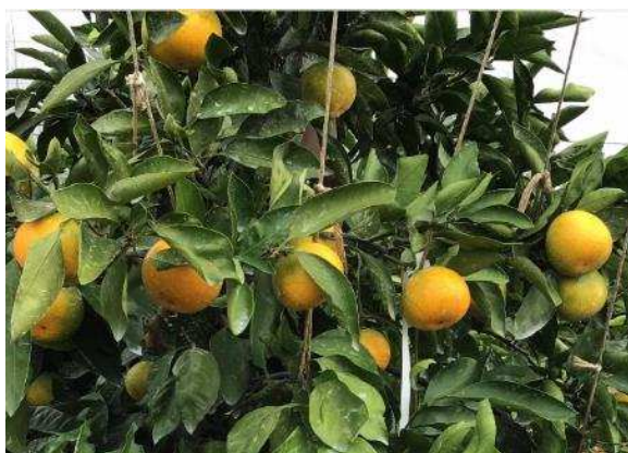
写真1 結実調査中の選抜系統

浮皮が発生しない等温暖化に対応した系統や樹がわい性でコンパクトになり省力的な系統を珠心胚実生由来個体、放射線照射個体より育成選抜しています（写真1、2）。また枝変わりなど優良な特性を持った系統を県内で探索調査を行っています。