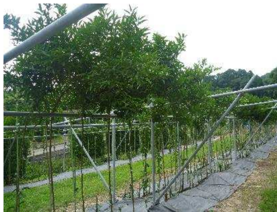
写真5 中晩柑選抜用棚

通常の仕立て方では種をまいてから結実までに長い年月を要するため、少しでも早く実をつけさせるために棚仕立てで育成し、特性の評価および選抜を行っています（写真5）。優良だと評価した系統について、高接ぎおよび苗木での栽培特性を把握し、現地における適応性試験を経て、最終的に新品種として登録していきます。