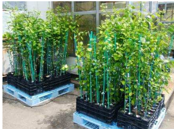
写真2 選抜中のわい性系統