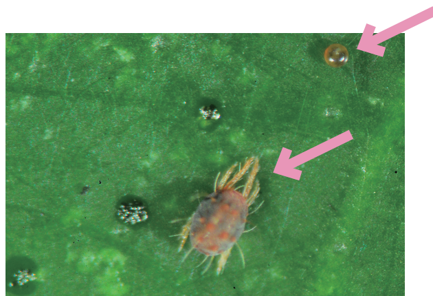
ミカンハダニ雌成虫(下)と卵(上)

ハダニの防除が非常に困難であり、大変大きな問題となっていました。防除が困難となった要因としては、効果が高い薬剤はあったものの、それらが同一系統の薬剤であったため、1系統(同じIRACコード)薬剤への使用頻度が極端に偏りすぎ、抵抗性の発達が早まったものと考えられます。その後はコロマイト水和剤、バロックフロアブル等が登録され、さらにマイトコーネフロアブル等の系統の異なる薬剤が数種類登録されたことで、以前からすると落ち着いた感があります。