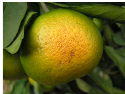
‘上野早生’の日焼け果