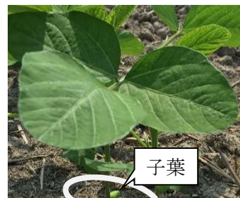
1回目の培土時期の目安

※台風通過後は、葉の損傷により葉焼病などの病気の発生が想定される。田廻りを励行し、発生を確認したら適切に防除を行う。また台風の進路、雨量によっては、有明海沿岸は潮風による塩害の恐れがあるため、降雨量が少ない場合は散水により塩分除去も想定しておく。