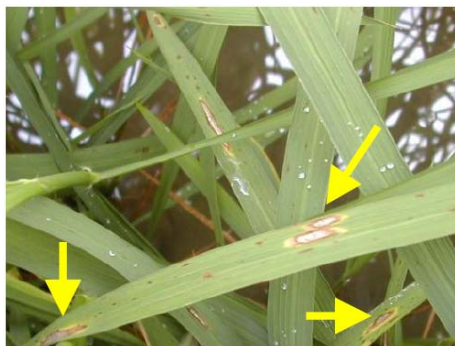
▲いもち病（農業技術防除センターより）