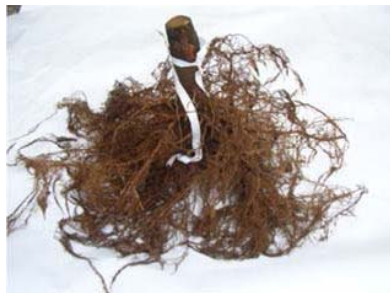
図3 育成後のマンシュウマメナシ台の根