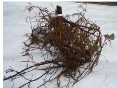
図4 育成後のヤマナシ台の根