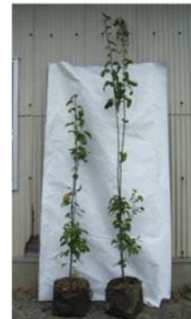
図2 右：マンシュウマメナシ台 左：ヤマナシ台