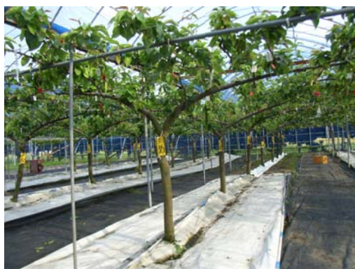
図2 定植5年目の様子