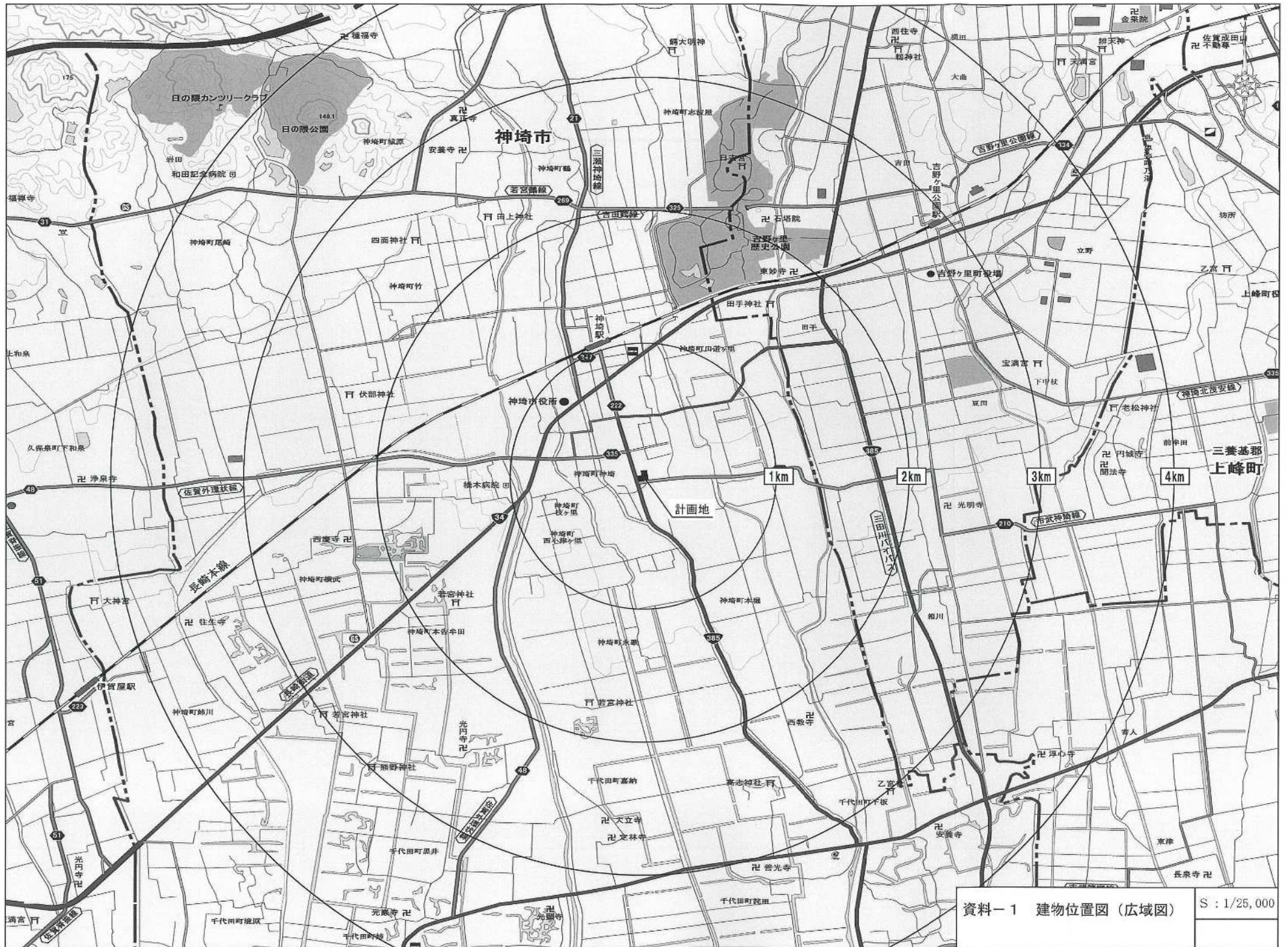
資料-1 建物位置図(広域図)