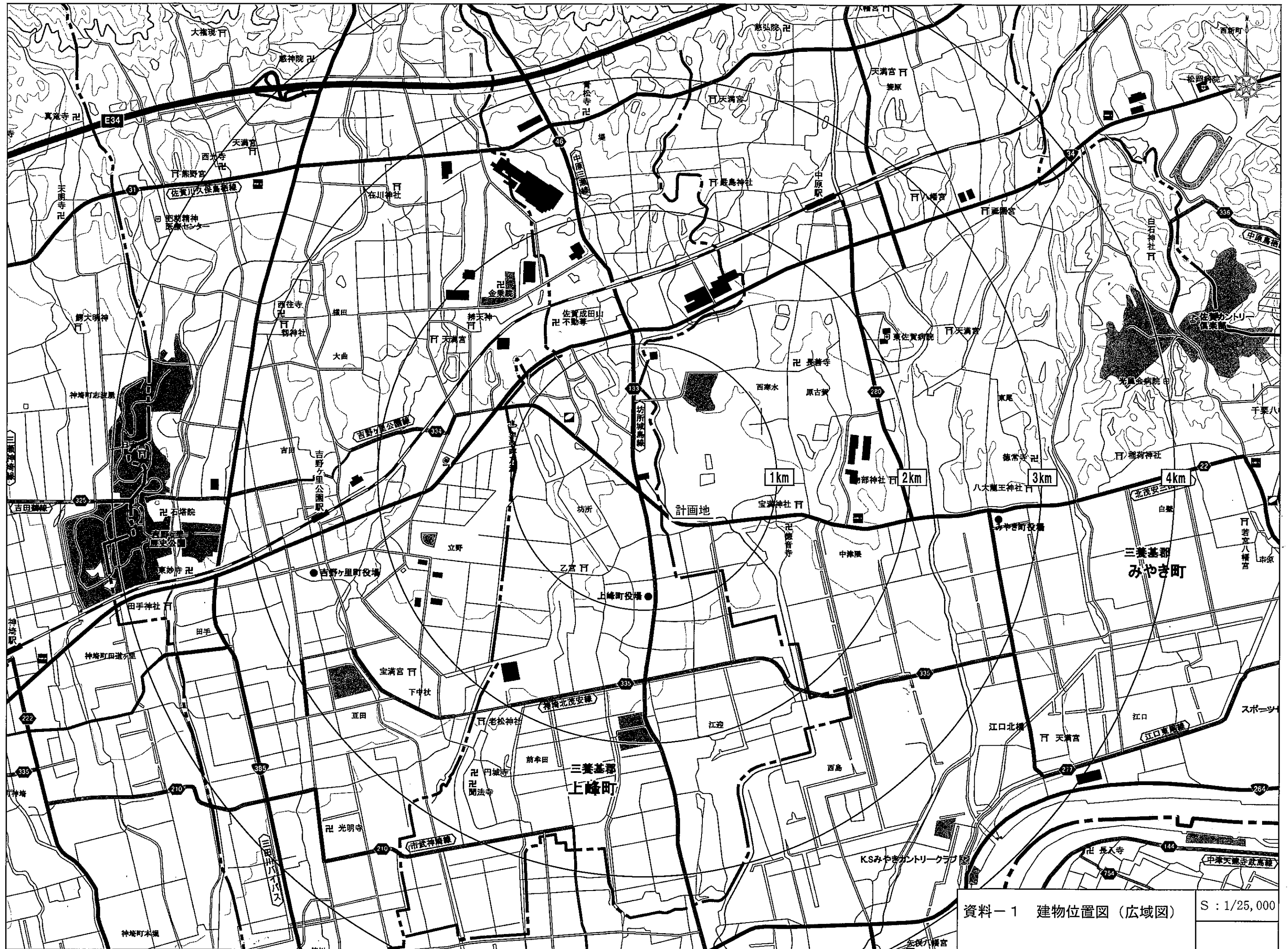
資料-1 建物位置図 (広域図)