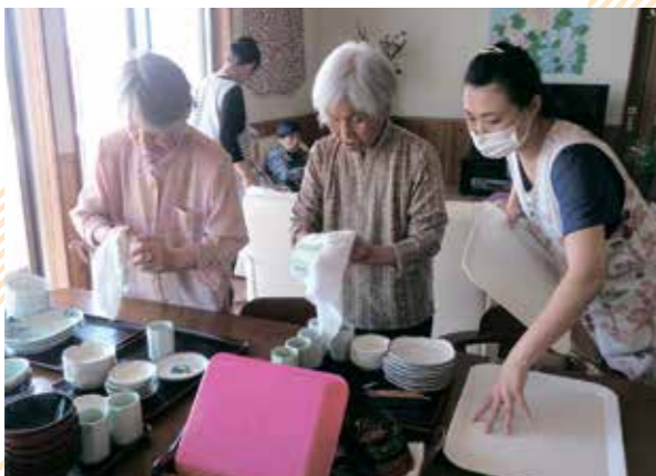
△認知症ケアの様子

適切なケアが着実に提供できるよう、県では、認知症の方を一定の時間観察・記録してケアの質を評価し、その結果を現場の