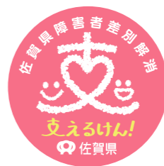
△佐賀県障害者差別解消のシンボルマーク