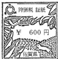
様式第2号(第3条関係)