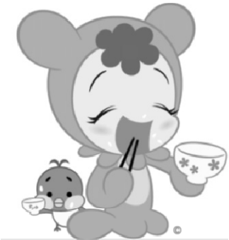
さがびよりイメージキャラクター ひよりちゃん&ちゅんくん