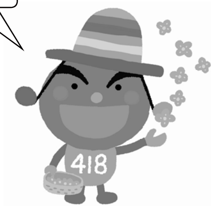
418(しあわせいっぱい)プロジェクトPRキャラクター はっぴーソンリサ