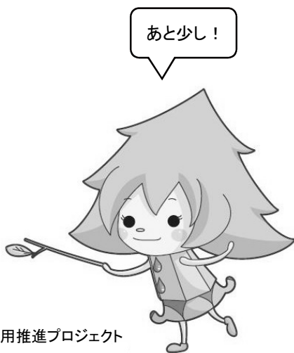
県産木材利用推進プロジェクト モクリン

《自由意見》 ①～③の質問や理由について思うこと、または「産業」の分野について、ご意見・ご提案があればお聞かせください。