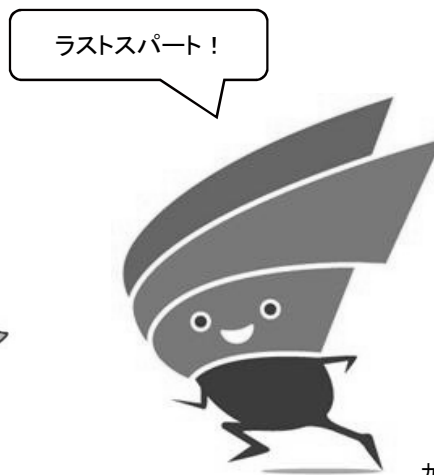
九州新幹線新鳥栖駅PRキャラクター トッスイ