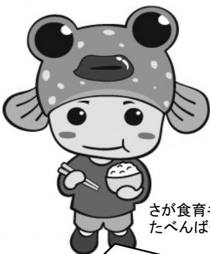
さが食育キャラクター たべんぱくん