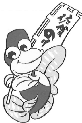
佐賀海苔マスコットキャラクター 佐賀のリジャンプくん