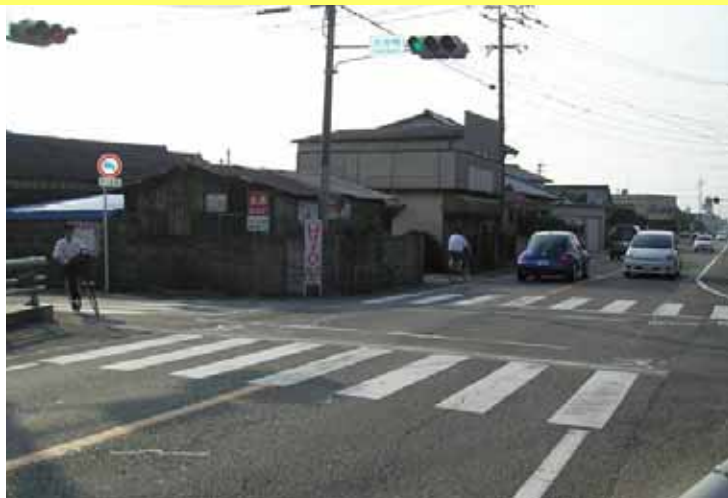
歩道未整備により、通学者が危険にさらされている