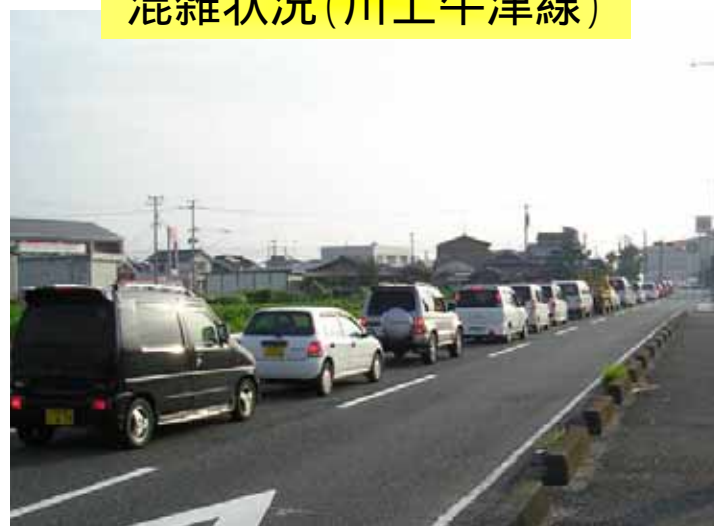
混雑状況 (川上牛津線)