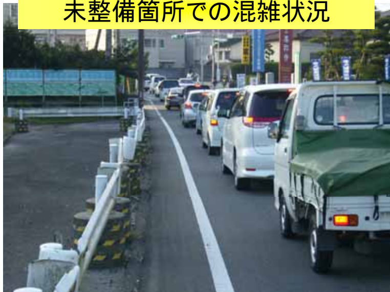
未整備箇所での混雑状況