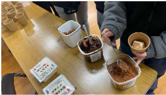
12月2日 唐津商業高等学校(定時制) (唐津市)