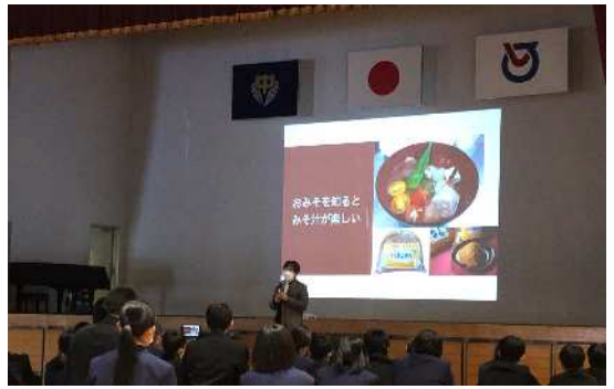
12月4日 福富中学校(白石町)