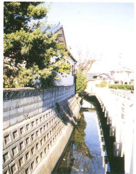
羽佐間水道（多久市立納所小学校付近）