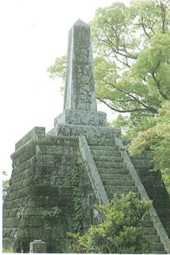
水功の碑（大和町石井樋）

皆さんも、身近な地域にある水利関係の施設を調査研究してみませんか。きっとすばらしい発見をし、先人の業績に驚きをもつことでしょう。