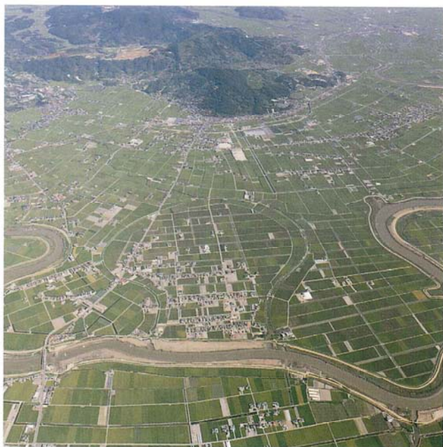
現在の水田全景

海水が逆流する低地であるため、これらの河川の水を農業に利用できないもどかしさがありました。