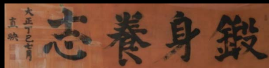
鍋島直映書 校長室

◇かつて佐賀城は「栄城」と呼ばれ、城内の一角にある本校は、今も「栄城」の名で親しまれています。