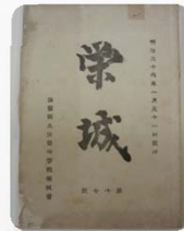
佐賀中学校榮城会発行(明治30年～)「榮城」表紙

江戸時代に完成した佐賀城は、榮城という別名でよばれていました。その城内跡地の一角に建てられた本校は、地域の方々にも「榮城 EIJO」と親しみを込めて呼ばれています。