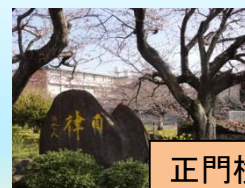
正門横の校訓石碑と桜