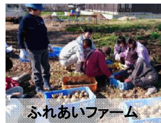
ふれあいファーム