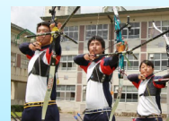
全国大会出場の アーチェリー部・ボクシング部