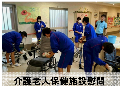
介護老人保健施設慰問