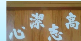
創立80周年記念 校訓額