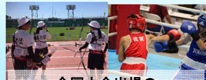
全国大会出場のアーチERY部・ボクシング部