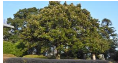
開校記念樹(樹冠6mのタイソク)