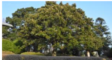
開校記念樹(樹冠6mのタイザンボク)