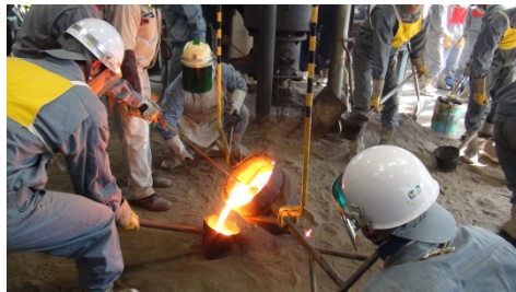
(キューポラによる熔解実習風景)