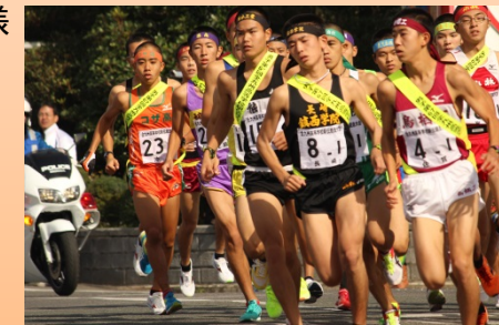
(駅伝部:全国大会出場回数41回)

《全国大会出場部》 駅伝部、体操部、レスリング部、カヌー同好会、電子部(マイコンカーラー)