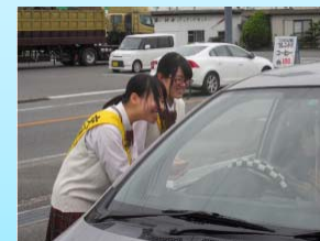
交通安全の街頭キャンペーン

国際ボランティア部を中心に、地域貢献を目指し、各々ができるボランティア活動に取り組んでいます。