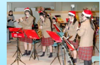
介護施設訪問コンサート