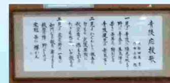
旧武雄青陵高校から校歌と応援歌を受け継ぐ