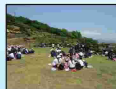
中高合同の歌垣山遠足