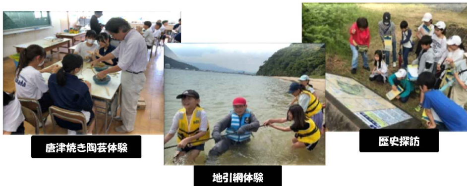
唐津焼き陶芸体験

唐津市では、児童生徒の生きる力を育むため、学校・家庭・地域社会が連携し、地域の特色や人材を生かしながら、児童生徒を支援する「いきいき学ぶからつっ子育成事業」に取り組んでいます。自然環境や歴史、伝統文化を生かした体験活動の実施、地域人材を生かしたキャリア教育の推進を行っています。