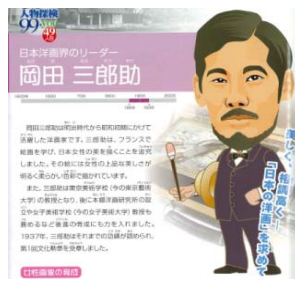
岡田三郎助の紹介