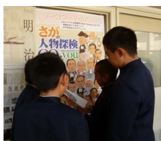
中川副小学校のクイズ大会