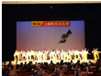
町民文化祭での発表