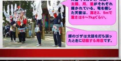
生徒発表スライド