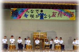
【文化発表会での演奏】