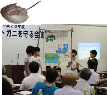
【カブトガニを守る会総会での発表】