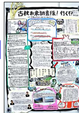
小学生の部優秀作品