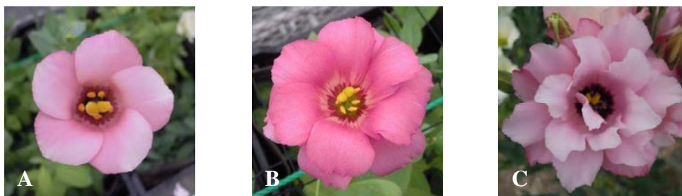
図1 一重咲き、二重咲きおよび八重咲きの花