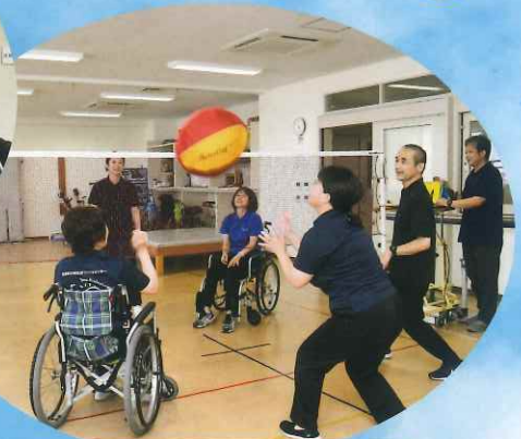
スポーツリハビリ