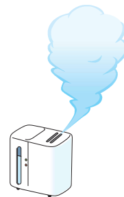
部屋の 適度な湿度

インフルエンザは、主に、咳やくしゃみの際に口から発生する小さな水滴（飛沫）によって感染します（飛沫感染）。普段から“咳エチケット”（①他の人に向けて咳やくしゃみをしない、②咳やくしゃみが出るときはマスクをする、③手のひらで咳やくしゃみを受け止めたら手を洗うことなど）を心がけてください。