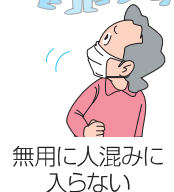
無用に入混みに 入らない