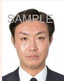
てかりやムラがあるもの