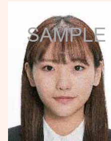
ノイズ（画像の乱れ）があるもの

デジタル画像の過剰な圧縮等が原因となってノイズ（画像の乱れ）が発生しているものや、ジャギー（階段状のギザギザ模様）、印刷時のドット（網状の点）やインクのにじみがあるものは不適当です。写真専用の用紙を使用し、鮮明な画質で印刷してください。