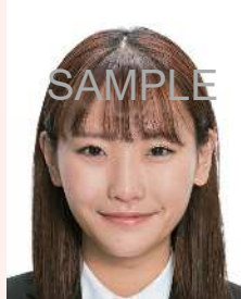
口角が上がる等により実際の容姿と著しく異なるもの