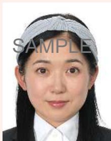
帽子やヘアバンド等により頭部が隠れているもの