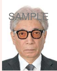
色付きの眼鏡やサングラス

より確実な本人確認のため、 眼鏡を外した顔写真を推奨します 。眼鏡を着用するとき、色付きのレンズや反射、影があるものは不適当です。また、目を妨げる縁、フレームがないものに限ります。医療上必要とされない限り、サングラスや処方のない色付きの眼鏡は不適当です。