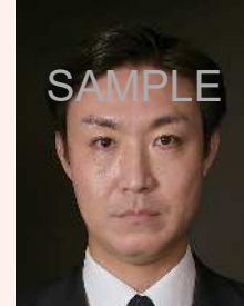
背景の色が濃いもの