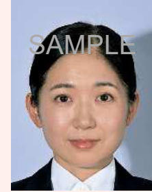
背景の影があるもの