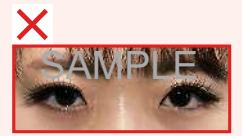
つけまつげ、まつげエクステの影があるもの