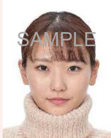
タートルネック、パーカーのフード、首を覆うもの等、衣服等により顔等の顔の一部が隠れているもの