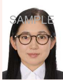
眼鏡に照明が反射したものの