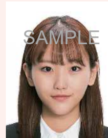
変形やマスク等々の画像処理をほどこしたものの