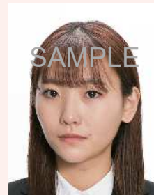
横を向いているもの