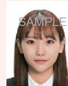
ジャギー（階段状のギザギザ模様）があるもの