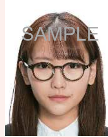
眼鏡のフレームが目にかかっているもの