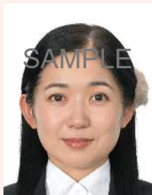
大きな装飾品や、装飾品で目、耳、鼻、唇等が隠れているもの