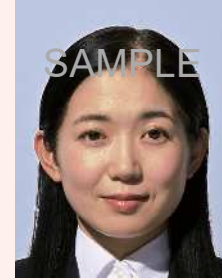
顔の影があるもの