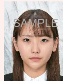
背景が柄模様であったり、凹凸のあるクロスが写り込んでいるもの