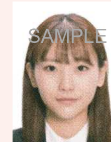
ドット（網状の点）やインクのにじみがあるもの