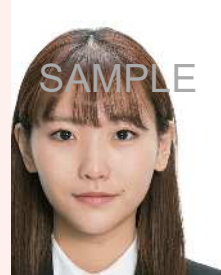
位置が片寄っているもの