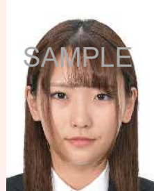
髪が目にかかっているもの