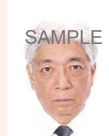
頭、髪、服装等と背景の境界が不明瞭なもの