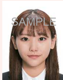
目を大きくしたり、顔のパーツを変形したもの

目を大きく見せたり、美白処理、顔パーツやほくろ、しわ等を修正する等して、本人のイメージを変えたものは不適当です。出入国の際、トラブルになる可能性があります。また、 左右反転 した写真は不適当です。