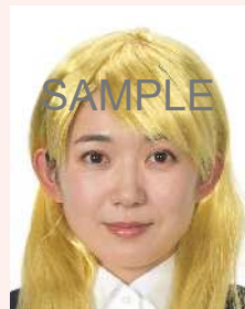
カツラ(ウィッグ)等により実際の容姿や雰囲気が変わるもの