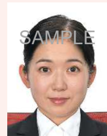
背景に異物が写り込んでいるもの