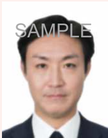
ピンぼけや手ぶれにより不鮮明なもの

撮影時にピントが合っていないかったり、手ぶれにより不鮮明なものや、顔にてかりやムラがあるものは不適当です。