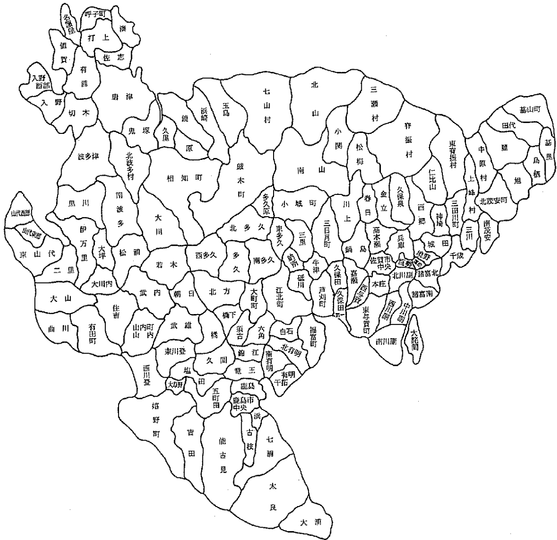
表31 農協合併推進当初の農協のすがた (昭和36年4月1日現在)