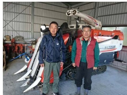
岳区集落協定 代表