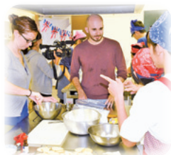
昨年の国際フェスタの様子