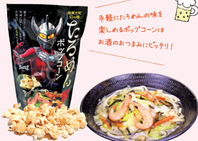
▲大町町のソウルフード「たろめん」