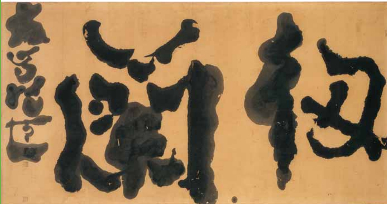
(箱根松坂屋旅館所蔵)