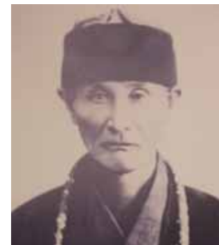
(小城市立中林梧竹記念館提供)