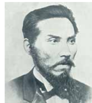
(佐賀県立佐賀城本丸歴史館所蔵)