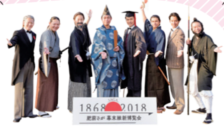
八賢人おもてなし隊

幕末維新期に近代国家の礎を作った8人の賢人を、親しみやすい歴史寸劇で紹介している劇団。「佐賀の歴史と誇り」を県民や観光客に広く伝えていきます。 ※今回の紙面では、鍋島直正役の方にご協力いただきました!