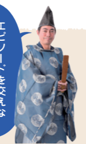
第10代佐賀藩主 鍋島直正 (八賢人おもてなし隊)

激動の幕末期に佐賀を技術力日本一の雄藩に導いた名君。佐賀藩第10代藩主に就任後、破綻寸前の財政を立て直し、人材育成に力を注ぎました。