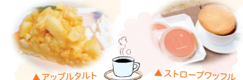
▲アップルタルト ▲ストロープワッフル