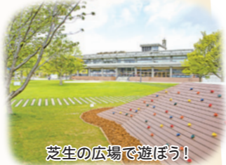
芝生の広場で遊ぼう!