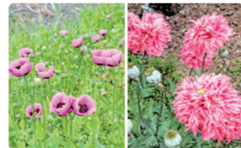
植えてはいけないけし (一重咲) (八重咲)

植えてはいけない「けし」を発見した場合は、最寄りの警察署、各保健福祉事務所または、薬務課までご連絡ください。